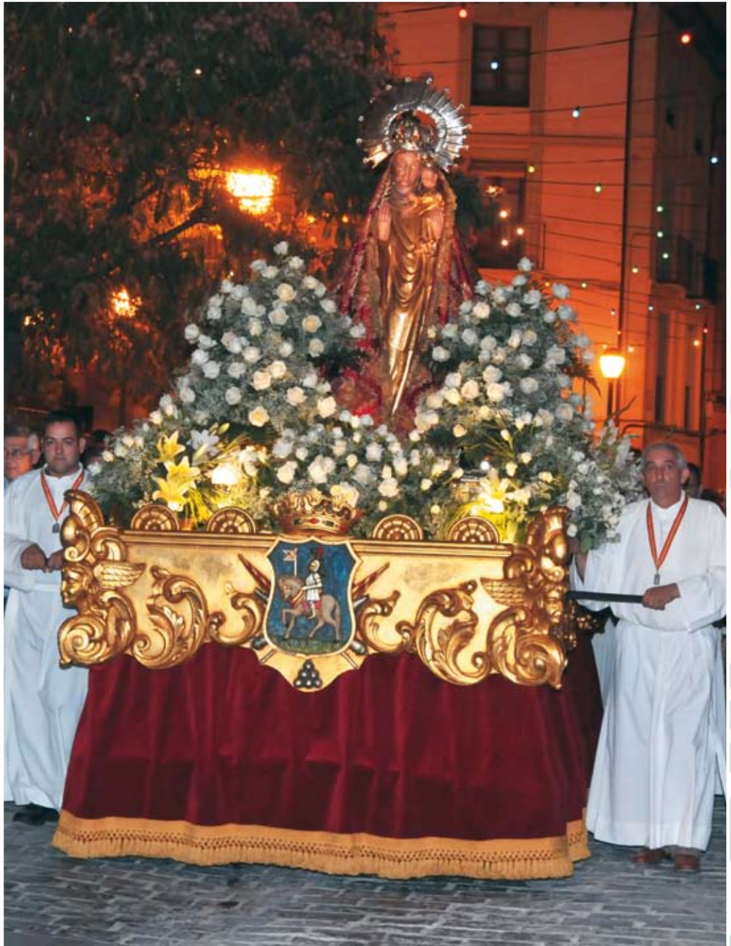
Nuestra Señora de la Oliva, Patrona de Ejea de los Caballeros