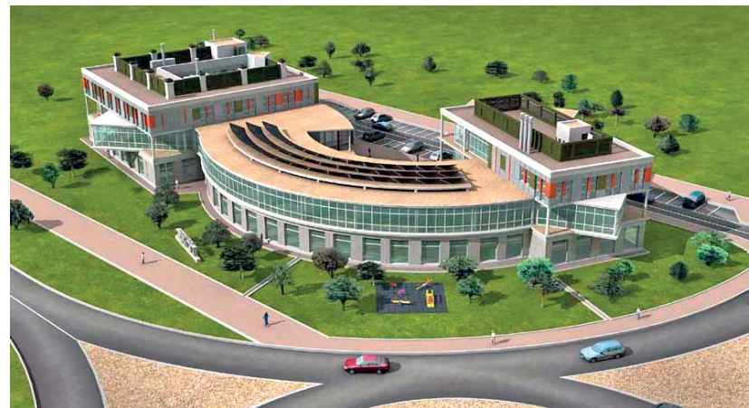
Centro de Negocios Exión

Próximamente este Centro se instalará en el Centro de Negocios Exión (Parque Científico Tecnológico Aula Dei en el Polígono Industrial Valdeferrín Oeste de Ejea de los Caballeros).