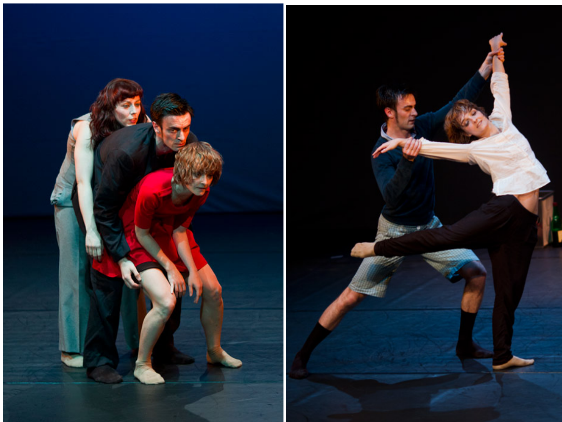
¿Y los sueños? Sueños son Espectáculo de danza contemporánea para las miradas más ingenuas.

De esta idea nacen las residencias artísticas de Teatro Arbolé y en esta ocasión con un grupo de jóvenes bailarines y coreógrafos. Este es el resultado de ¿Y los sueños? Sueños son . La última de nuestras producciones.